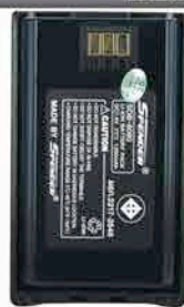
Battery 1200 mAh.