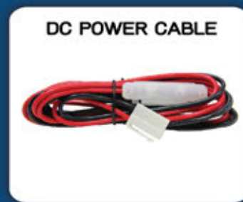
DC POWER CABLE